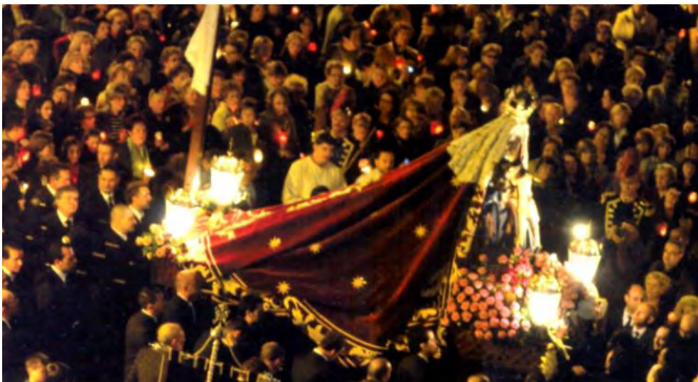
Procesión de La Dolorosa